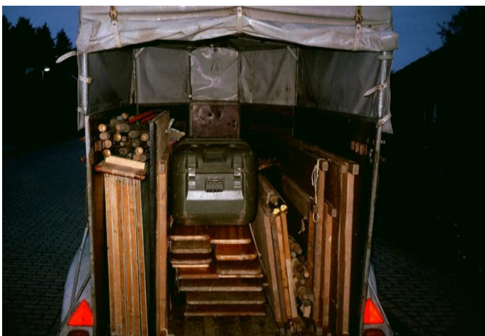
Transport der Ausstellung & Material zum Jubiläumstreffen des Trupp Lohengrin 2001 in Rastede...