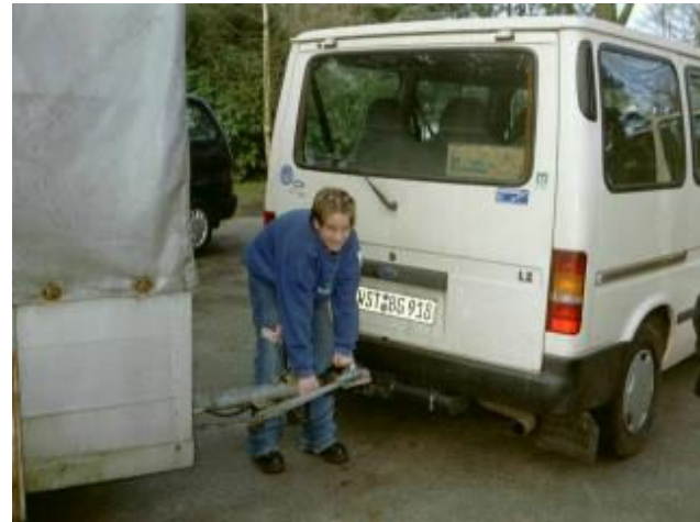
Fotos: Anna Jöstingmeier vom Stamm Jadeburg beim Ankuppeln des Anhängers - Praxisteil Gruppenleitercrashkurs Teil I Jan. 2002 in Tossens...